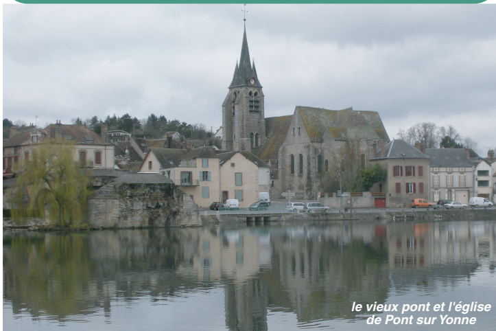
le vieux pont et l'église de Pont sur Yonne